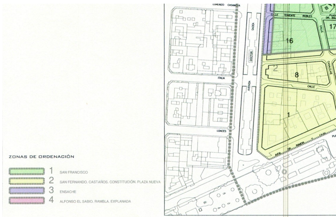
Imagen 3. Copia parcial del plano O4.Zonas de Ordenación del Plan Especial de Protección y Conservación del Centro Tradicional de Alicante.

Por otro lado fuera del ámbito del PEPCCCT las manzanas con frente a la avenida de Doctor Gadea están calificadas por el PGM 1987 como zonas de ordenación de Ensanche en grado 1, nivel a (Clave ES1a).