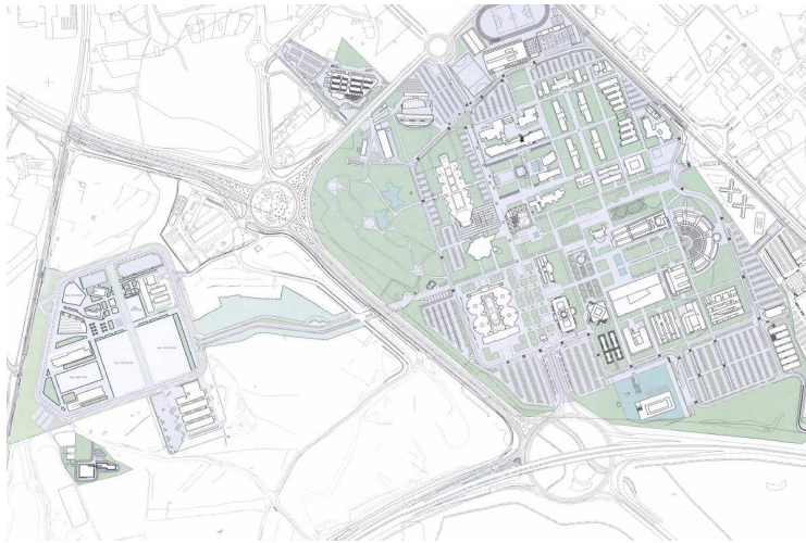
Situación actual del Parque Científico y campus de la Universidad de Alicante