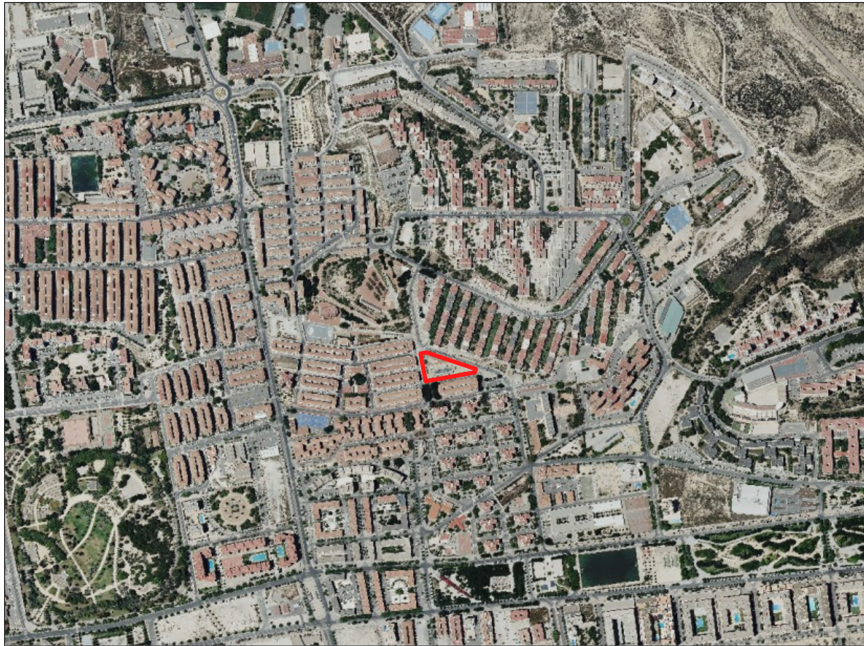
N I.1 SITUACIÓN (ORTOFOTO) 1 1/10.000 0 50 100 250 m