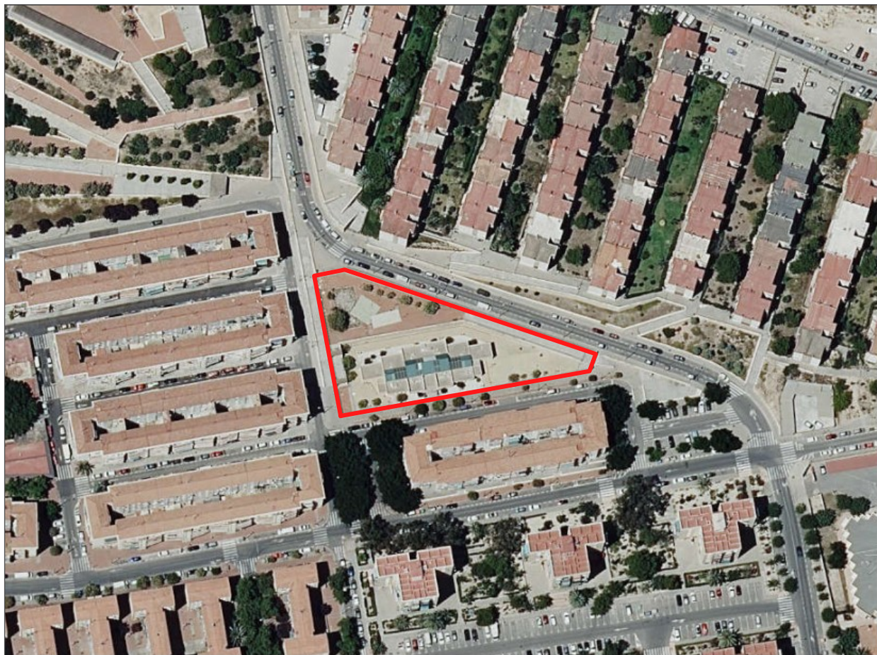
N I.1 EMPLAZAMIENTO (ORTOFOTO) 3 1/2.000 0 5 15 50 m