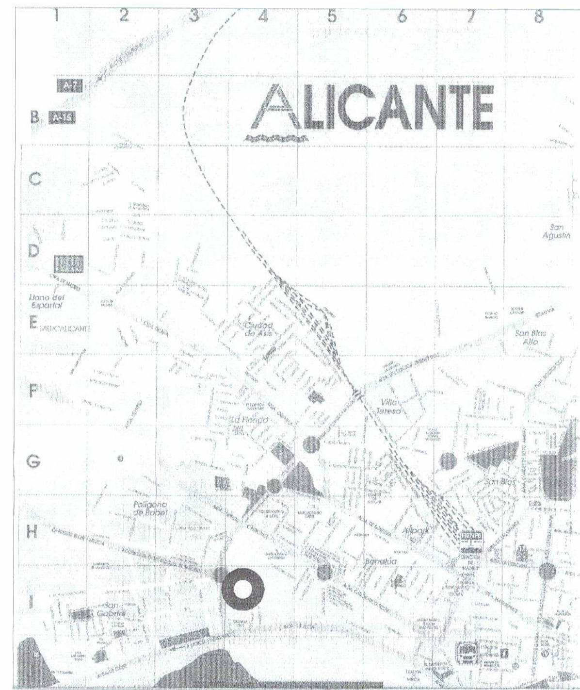
PLANO DE SITUACIÓN S/E