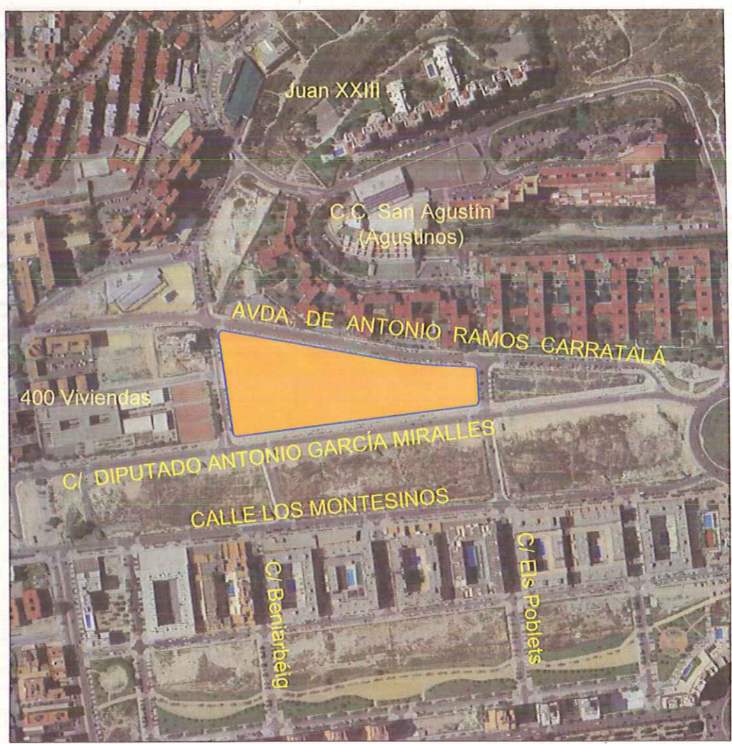
Foto Aérea 2008