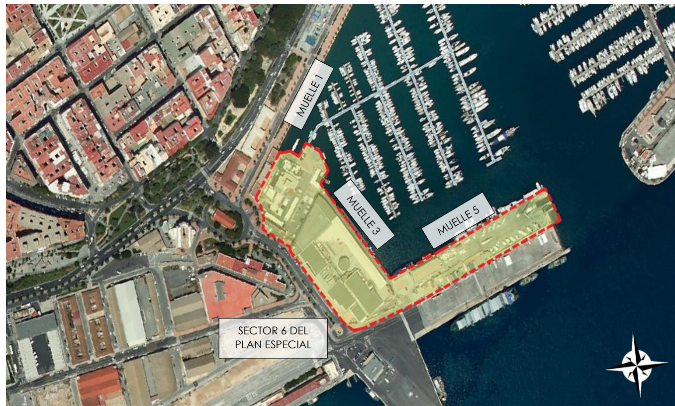
Ámbito de la modificación puntual nº6 del Plan Especial