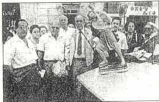
Dirigentes y socios del Montepío, momentos antes de iniciarse la marcha por la ciudad.

Entre los diversos actos, destacaron el Trofeo San Cristóbal de ajedrez, dominó, damas y parchís, la misa en honor del Patrón en Nuestra Señora de Avila, y la comida de hermandad en el Restaurante Juan