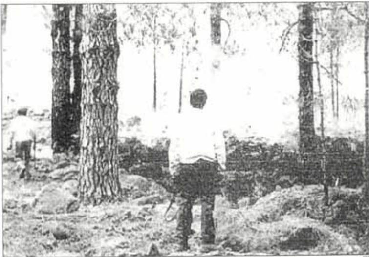
El incendio de La Palma ha afectado ya a cinco municipios y ha arrasado más de 2.500 hectáreas desde el pasado miércoles