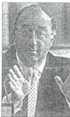
El presidente Julio de España

Respecto del congreso de Estadística, que tendrá lugar a finales de este mes en la Facultad de Bellas Artes de Altea, la Dipu-