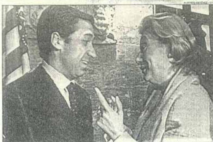
La presidenta del Congreso, Luisa Fernanda Rudi, con el presidente de la Generalitat, Eduardo Zaplana

Pues bien, dado que a partir de ahora el «bocado» que supone la sustitución del actual líder es mayor habrá que conculcar en que las pasiones que despierte este anuncio alumbraimiento de cargos gemelos crecerán de forma exponencial. En consecuencia, bueno será preparar el ánimo para encontrar a un presidente de la Generalitat más apasionado a partir de estos momentos, justo con la