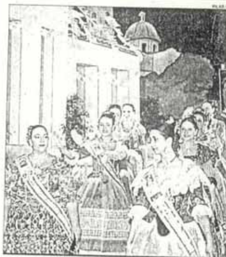
Un instante del acto de elección de la Bellea del Foc celebrado el sábado

Entre las anécdotas, citar la sorpresa de la hoguera La Entrà al Poble al repetir por segundo año Bellea Infantil. Otro hecho