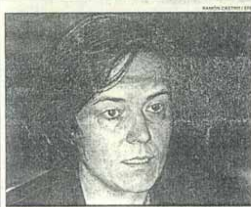
Loyola de Palacio, comisaria europea

llegada del euro. «Eduardo Zaplana está en la cabeza de Aznar, de eso no cabe la menor duda», comenta un parlamentario popular tan excelentemente bien informado como discreto al que habrá