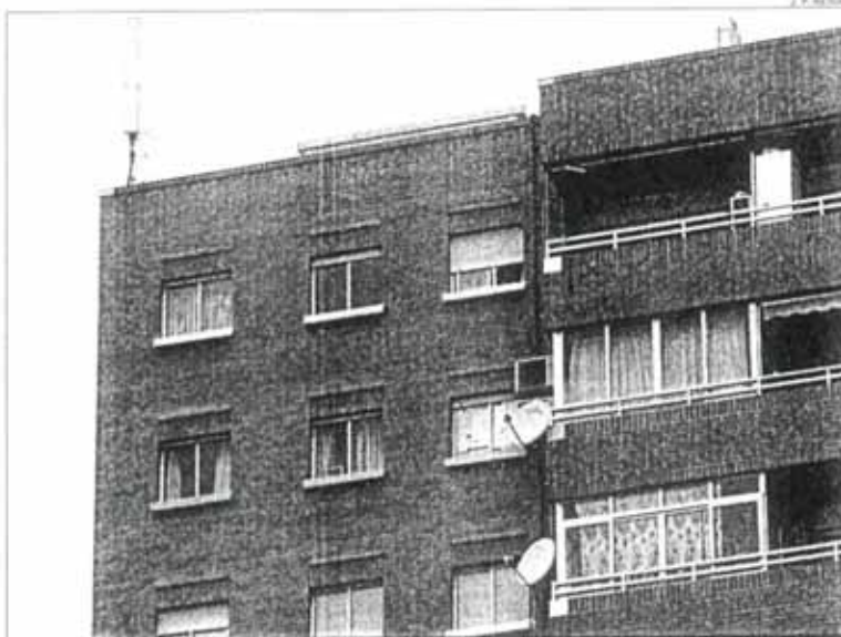
Antena del edificio de Cruzada Martínez Morellá, 3, que el juzgado ordena demoler al dar la razón al Ayuntamiento.

un plazo de 15 días. En el fallo se subraya que para la instalación de este tipo de antenas, que es una «actividad calificada», es necesario que se obtenga la correspondiente licencia de actividad y de apertura, y que si funciona sin licencia «el alcalde deberá proceder a su clausura». Además, en la sentencia se destaca que la petición de licencia para instalar la antena en este edificio situado junto a Juan XXIII «fue denegada por acuerdo de la Comisión de Gobierno de fecha 2 de enero de 2003, al no haberse subsanado las deficiencias documentales, y la legalización no resultaba factible al in-