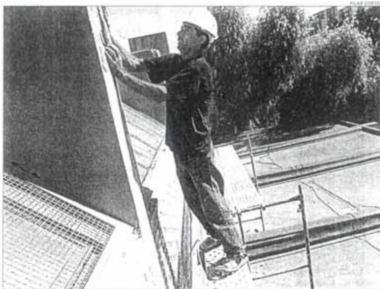
Un obrero trabaja en el exterior del colegio Gloria Fuertes en el comienzo de las obras de refuerzo de la estructura

El espacio con que cuenta este colegio es el argumento que aducen responsables de Educación para mantener el seguimiento de las clases al tiempo que se realizan las obras. Hasta el momento se ha desplazado de aula a medio centenar de alumnos porque algunos de los pilares que precisan intervención se encuentran en estas clases. En el colegio admiten que las obras van sin duda a causar más molestias que si no estuvieran, pero que llevan mucho tiempo esperándolas y que los técnicos les han asegurado que con desplazarse a otra de las alas del centro a algunos de los alumnos es su-