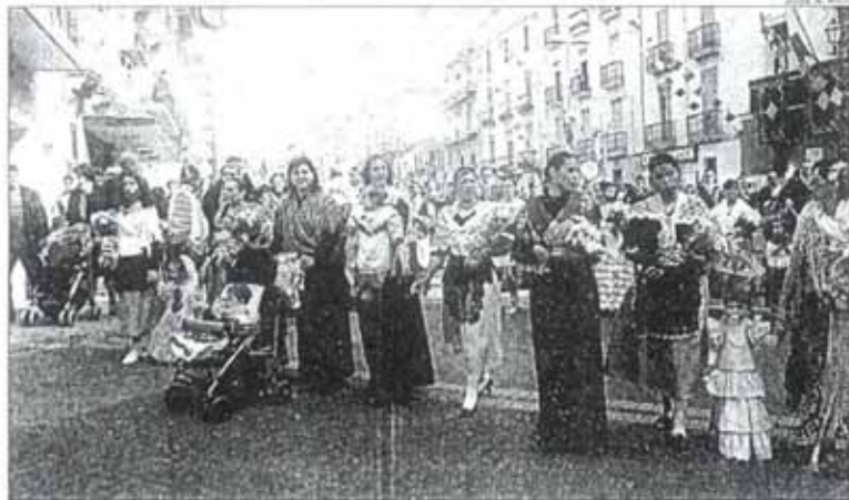
Imagen de la Ofrenda Floral celebrada ayer por la mañana en La Plaza de Xixona

La Ofrenda de Flores que tuvo lugar ayer por la mañana llenó La Plaza de Xixona de público, que acudió a disfrutar del colorido y vistosidad de este acto tan especial de las Fiestas de Invierno. Decenas de mujeres desfilaron ataviadas con los trajes típicos de las pobla-