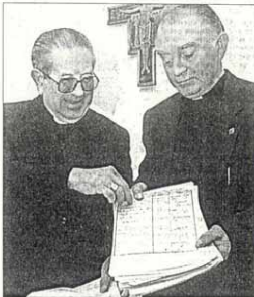
El obispo y el párroco de San Nicolás muestran las 50.000 firmas recogidas

A la imagen de la Virgen le será impuesta una corona de plata dorada adornada con joyas donadas por los alicantinos el pasado siglo y ese día lucirá traje y manto que desde hace dos años se está bor-