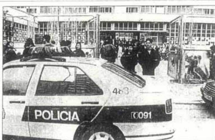
Imagen de archivo de la Policía en el Politécnico cuando la manifestación contra la expulsión de las chicas.

Por otro lado, el proyecto para la construcción del centro de reeducación que sustituirá al Granadella lo presentará la Comisionada para el Menor de la Comunidad Valenciana el próximo mes de junio, según anunció García Merita hace escasos días.