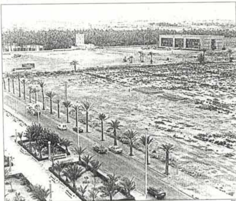
Terrenos del Campus de Elche sobre los que se levantarán los nuevos edificios

FACULTAD DE DERECHO. En la última reunión de la Comisión