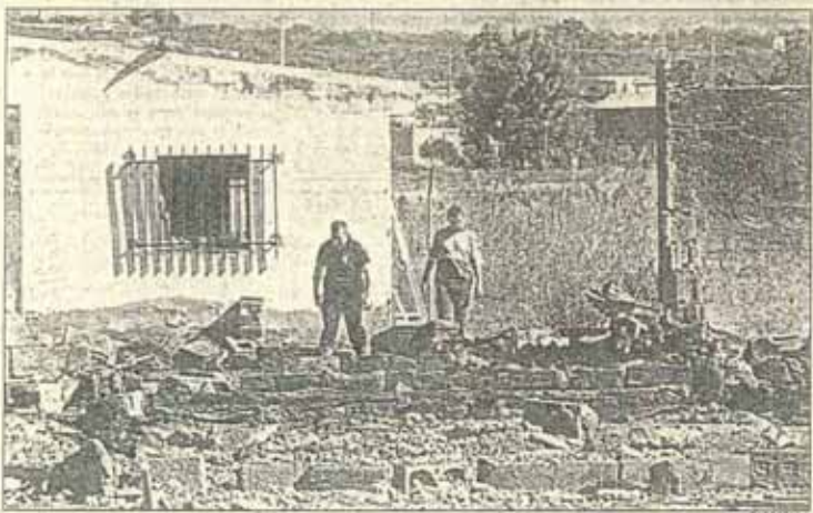
Una nueva explosión en una caseta de Pirotecnia Alicantina provocó daños materiales aunque no personales.

Tres coches de Bomberos con unos 20 efectivos y miembros de la Policía Local acudieron al lugar.