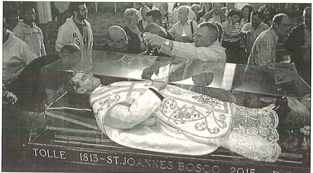
La familia salesiana recibió anoche la reliquia de Don Bosco, que permanecerá hoy en el colegio y en la parroquia María Auxiliadora. RAFA ARJONES