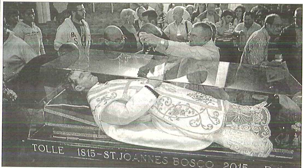
La familia salesiana recibió anoche la reliquia de Don Bosco, que permanecerá hoy en el colegio y en la parroquia María Auxiliadora.