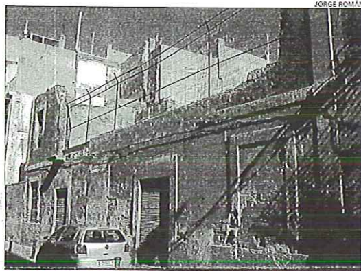
Edificio medio derribado en la céntrica calle de Barón de Finestrat

El aprecio por el patrimonio histórico no parece reinar en el Ayuntamiento de Alicante que consiente que, poco a poco, vayan desapareciendo los edificios antiguos que identifican a esta ciudad. Cada cierto tiempo se concede una licencia de demolición y, en el lugar que ocupaban estas señas de identidad de los alicantinos, se levantan torres de apartamentos. En las dos imágenes superiores mostramos dos solares que han quedado en el lugar que ocupaban dos bellos inmuebles que para muchos ciuda-