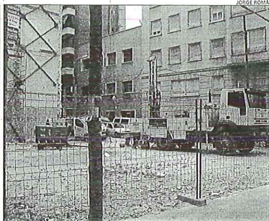
Solar de la calle San Vicente donde se alzaba un bello edificio; en la imagen derecha, el lugar de la calle Calderón donde había otro inmueble antiguo