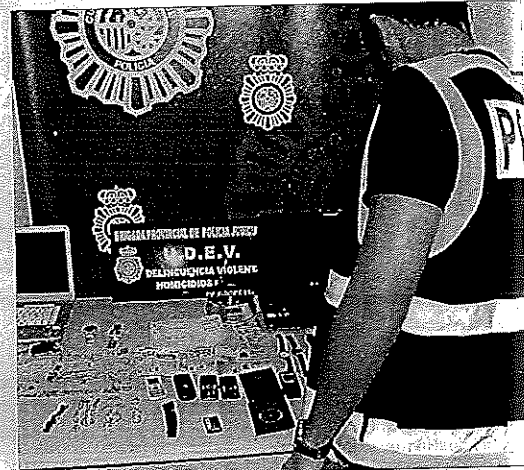
Las joyas recuperadas y los efectos intervenidos. INFORMACIÓN

Este robo puso a la Policía tras la pista de este grupo, averiguando que residían repartidos entre Valencia, Barcelona y Peñíscola. La operación la llevó a cabo el Grupo de Crimen Organizado de Cataluña y la Brigada de Atracos de Valencia. En el momento de su arresto, estaban preparando dos atracos en joyerías que llevaban vigilando desde hacía dos semanas para analizar qué medidas de seguridad tenían.