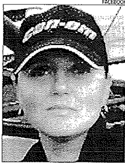
La mujer asesinada en Catarroja

La víctima, que es de origen lituano y residía con su marido y su hija de diez años en Laurí, trabajaba desde hacía tres meses en el salón de juegos recreativos. Con anterioridad, había trabajado como secretaria en la tienda de motos acuáticas Nautica El Perelló, cuyo dueño lamentó ayer «haber tenido