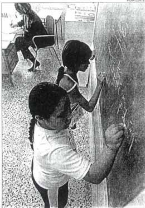
El colegio San Roque de Alicante dispone de dos maestros de apoyo

Por otra parte las dotaciones que se destinan a centros específicos CAES, de acción educativa singular, incluidas en la misma orden de ayudas para la Educación compensatoria que entró en vigor el año 2001, se han mantenido sin cambios prácticamente aunque el número de peticiones