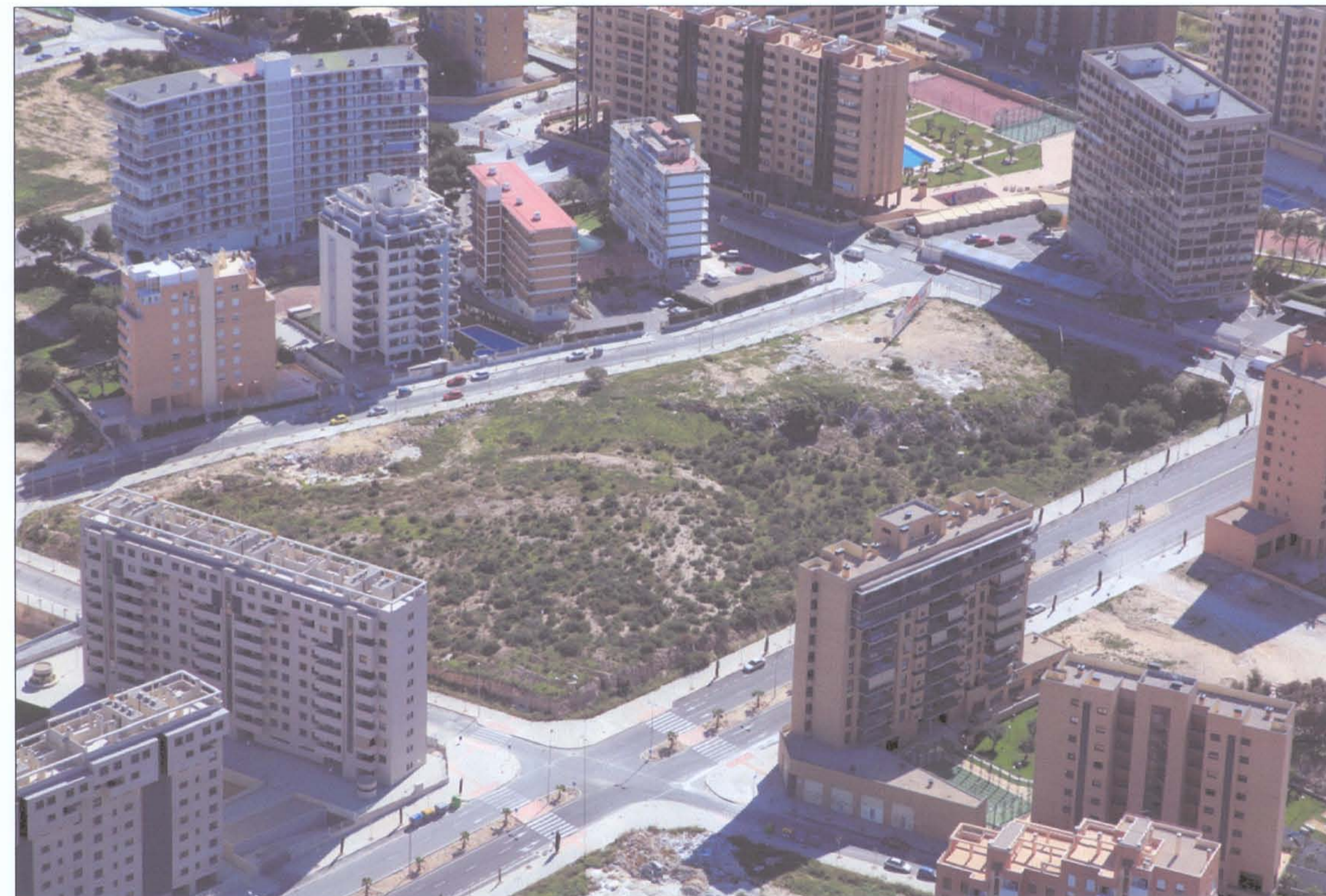
FOTO AEREA DEL ENTORNO

Dictaminado favorablemente por la Comisión Permanente de Urbanismo en su sesión ordinaria del 29 de octubre de 2008. El Secretario de la Comisión.