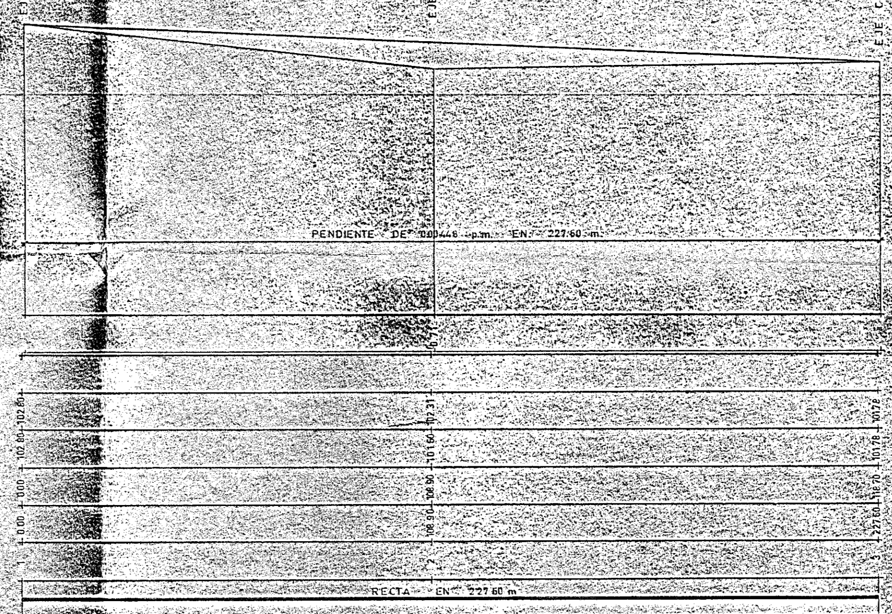
PERFIL 4-5 (CALLE D.)