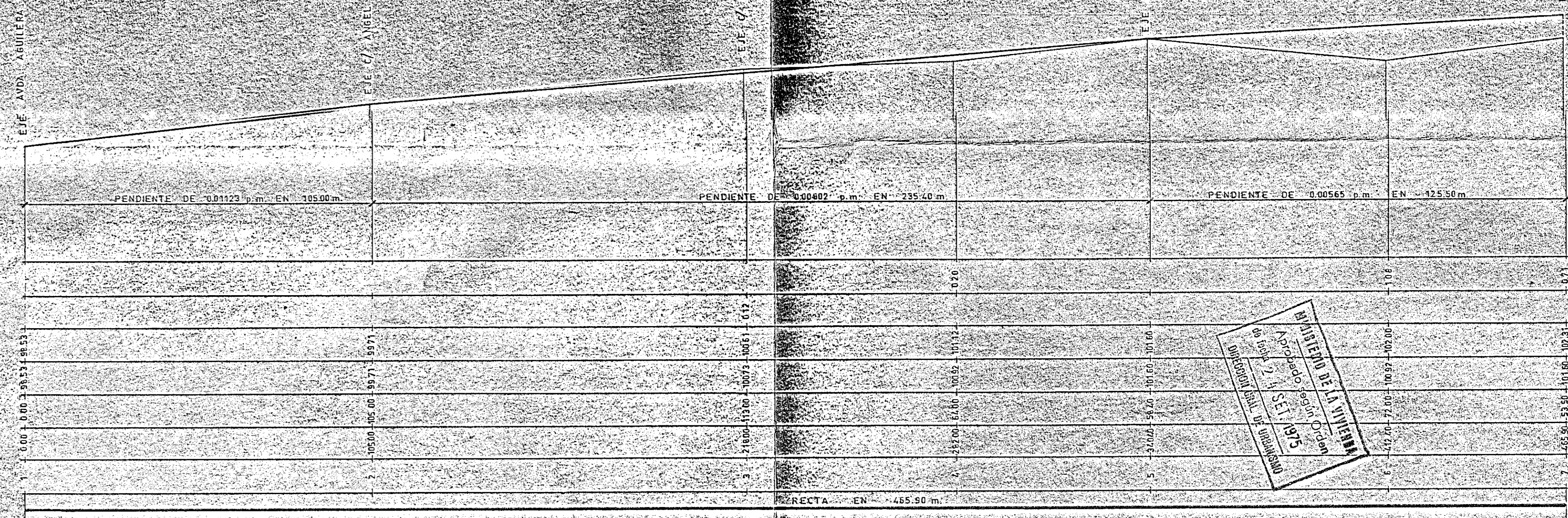
PERFIL 13-17 (C/ DEP RAMON MENDIZABAL)