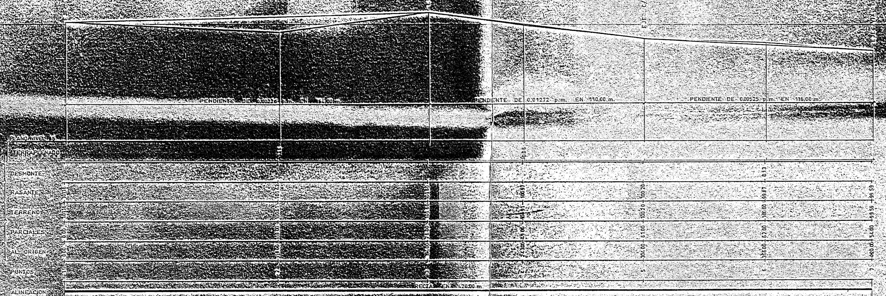
PERFIL 3-6 (C/ AUSSO Y MONZO)