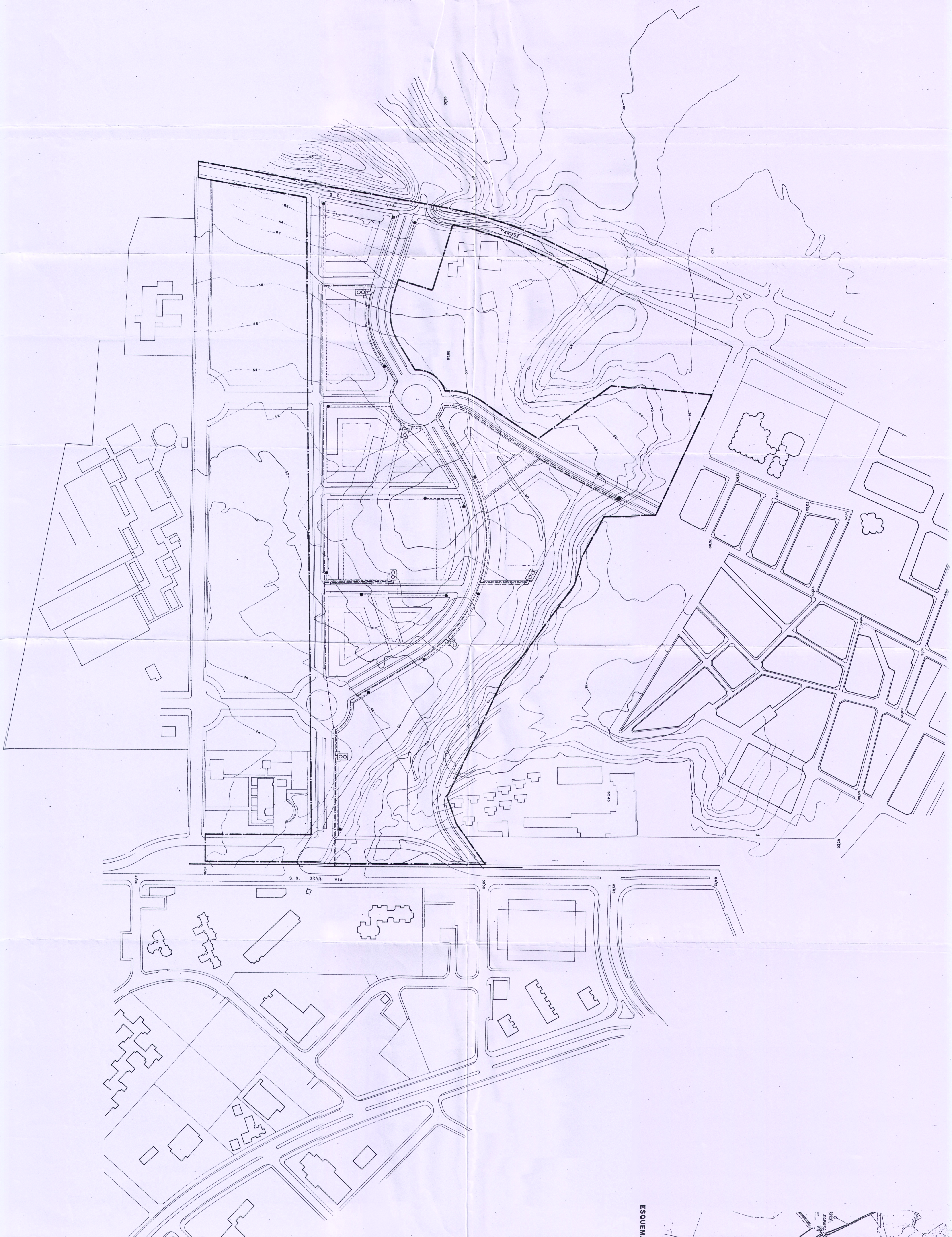
ESQUEMA CONEXION ESCALA APROXIMADA 1:300