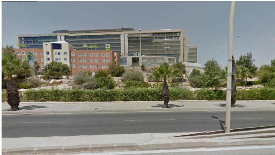
Ilustración 1: edificio de la OAMI desde la avenida de Elche.

En la imagen anterior, las zonas reclasificadas quedarían situadas detrás del edificio de la OAMI.