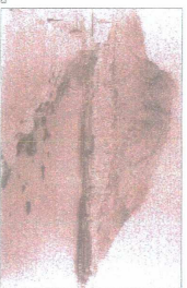
PLAN DE ALCOY 3.