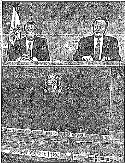
Arenas, junto a Fiqué, tras la reunión del Consejo de Ministros

En este sentido, insistió en matizar que el hecho de que el 31 de agosto fuera lunes ha hecho coincidir con las finalizaciones de muchos de los contratos realizados por el verano, y por esta razón la disminución del paro en este mes de agosto será proporcionalmente menor a la del año anterior.