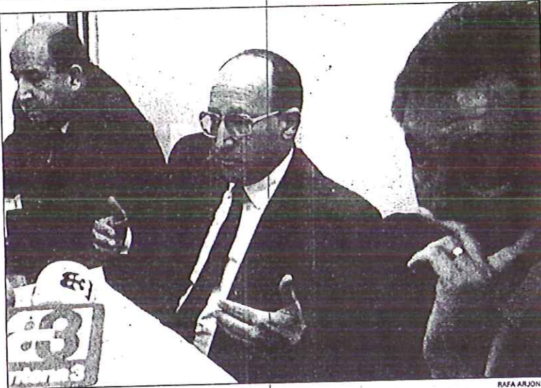
Un momento de la rueda de Prensa ofrecida ayer por la cúpula de la patronal provincial de la construcción