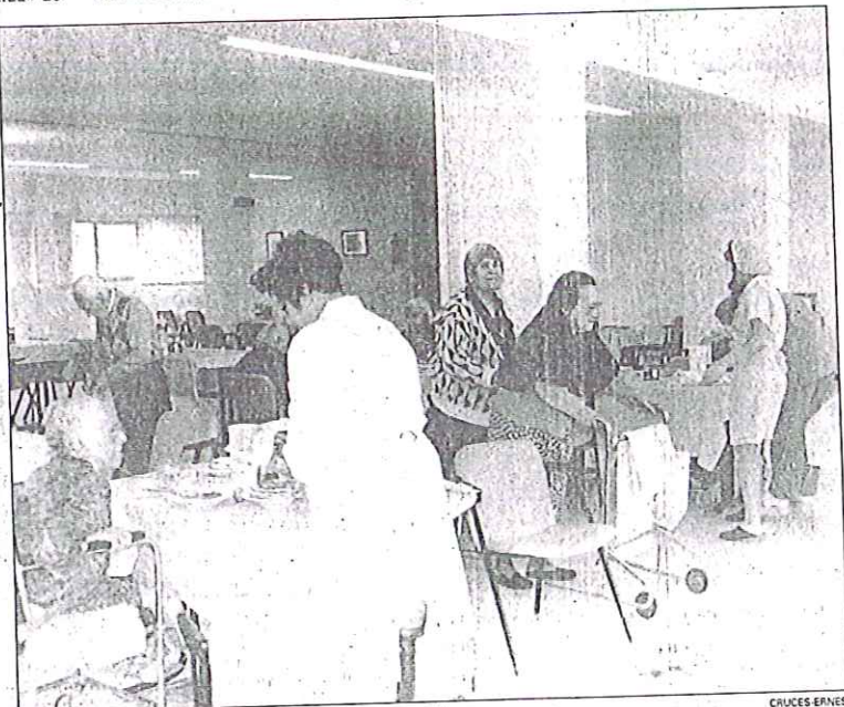
Trece auxiliares de enfermería atienden a los 85 ancianos que viven en el Geriátrico

SIN MATERIAL. El Sindicato de Auxiliares de Enfermería ha indicado además que en el Hospital Geriátrico falta material de lencería, de hostelería y sanitario indicando que en el caso de los enfermos no asistidos «las camas se cambian una vez por semana». El SAE asegura que sólo se baña a 17 ancianos