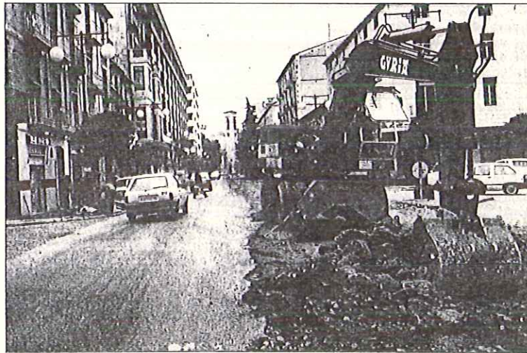
Las obras han comenzado por la zona de Cervantes

El plan de trabajo que tendrá la obra no se conocerá con exactitud hasta la próxima semana. «De momento —su-