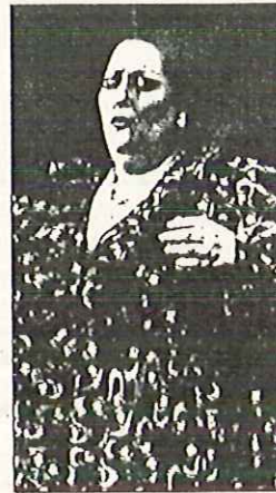
Montserrat Caballé deleitó al público de Varsovia