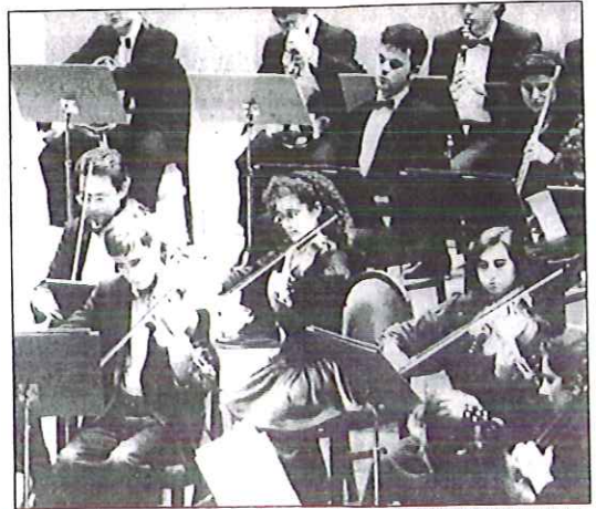
La formación en su anterior concierto en Alicante.

La Orquesta estará el martes en Pinoso, el miércoles en el Gran Teatro de Elche y un día después en la Iglesia de San Francisco de Játiva. Durante el mes de mayo participará en el Festival Internacional de Música de Villena.