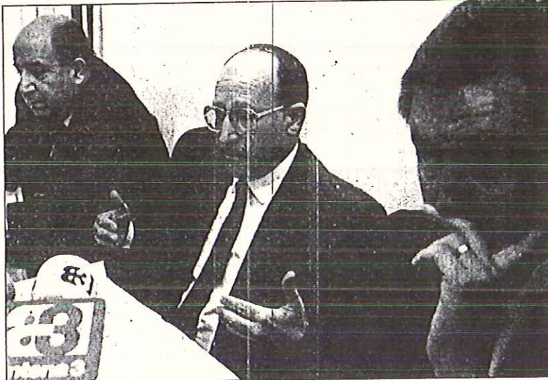
Un momento de la rueda de Prensa ofrecida ayer por la cúpula de la patronal provincial de la construcción